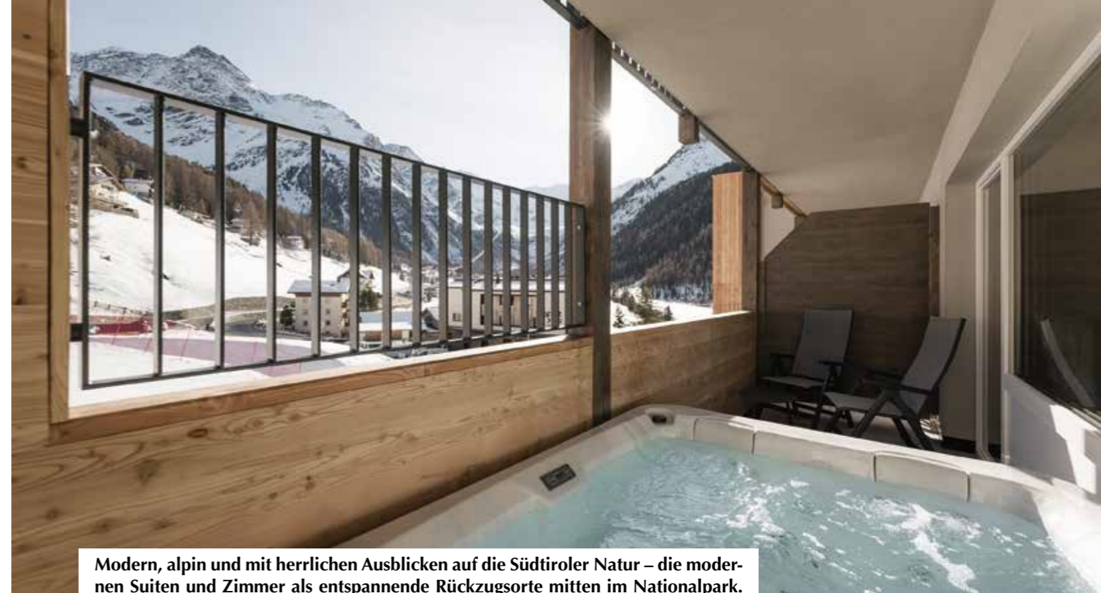
Modern, alpin und mit herrlichen Ausblicken auf die Südtiroler Natur – die modernen Suiten und Zimmer als entspannende Rückzugsorte mitten im Nationalpark.