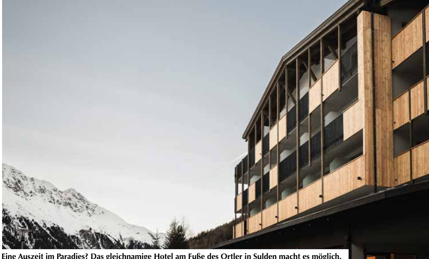
Eine Auszeit im Paradies? Das gleichnamige Hotel am Fuße des Ortler in Sulden macht es möglich.